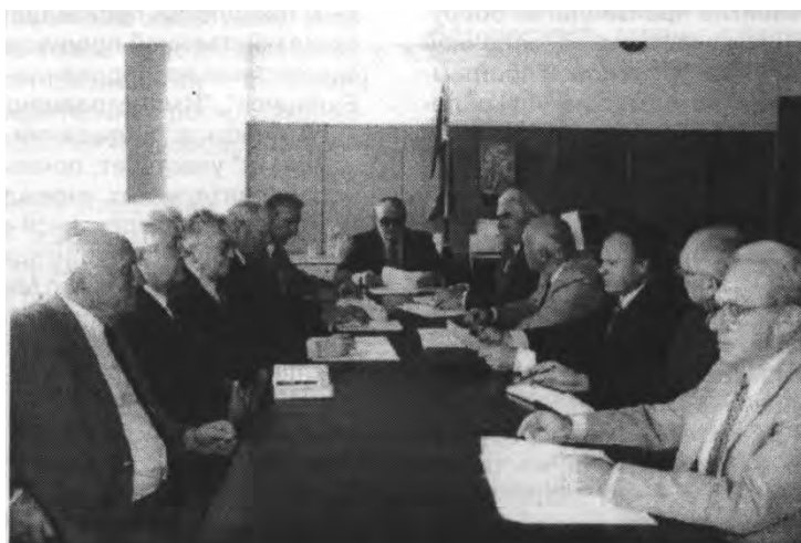
Заседание Президиума Академии аграрных наук Республики Беларусь